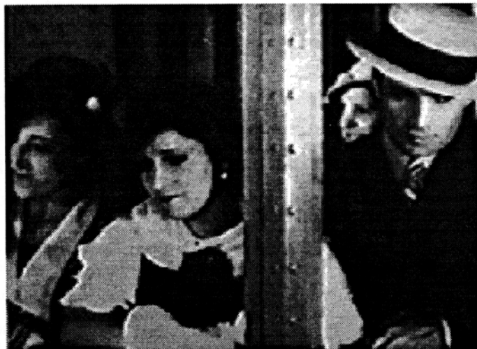
Fotograma de "Boliche" (1933), de Francisco Elías.

Resulta força difícil escollir un nombre limitat de títols d'entre aquesta llarga llista. Darrera de cada pel·lícula recuperada hi ha unes persones amb qui he establert una relació, gestions i viatges, visionat i fixat... en definitiva, moltes hores de dedicació, que fa que t'estimis cadascun dels films recuperats. N'he escollit, però, aquests deu perquè m'ha semblat que podien ser interessants per un motiu fonamental.