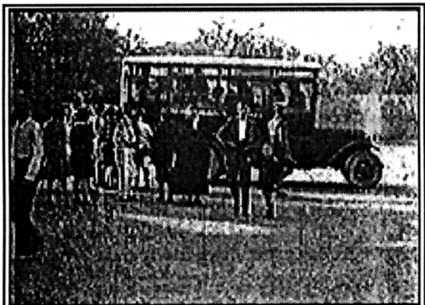
Foto: fotograma de "Boda d'Antoni Martra (fill)" (1935, Antoni Martra).

Els centenaris han de servir per reflexionar i conèixer millor l'esdeveniment que se celebra. Això és el que es farà a Tarragona, reflexionar i conèixer millor el cinema. Primer reflexionarem sobre la necessitat de conservar i salvaguardar per a les generacions futures els tresors del nostre cinema amb la I Assemblea General de Socis de Cinema-Rescat, la nostra associació, el dissabte dia 1 de març. Compartir experiències, ajudar-nos els uns als altres i endegar projectes per aconseguir rescatar de l'oblit el major nombre de pel·lícules que ens ensenyin el passat de Catalunya, la seva gent, la seva cultura, les seves