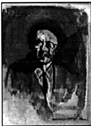
Retrat de F. Gelabert els darrers anys de la seva vida. Aquarel·la de Josep Marfà (1953).

La meva tasca en aquest mateix sentit va començar -i ha plogut molt des de llavors, ai las!- a mitjan de la dècada dels quaranta quan, tot just encetada la meva dedicació a la crítica de cinema, vaig poder comprovar aquella trista i quasi general indiferència dels que, llavors, formaven la petita indústria de la producció i distribució de pel·lícules a casa nostra, envers la primera generació de cineistes catalans.